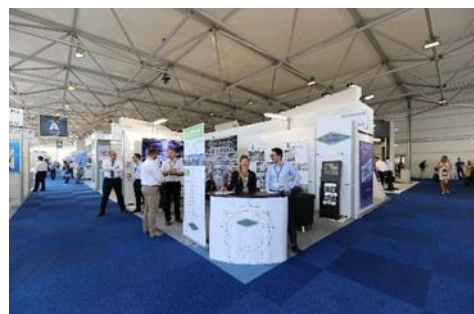
Visuels non contractuels