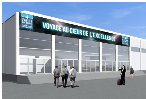
Simulation vue 3D de l'extérieur du pavillon.

Ce nouveau pavillon commun de 3000 m 2 , au cœur du Salon du Bourget (même endroit que les éditions précédentes) climatisé et clair, accueillera également 2 salles de conférences (100 places et 35 places) ainsi qu'un espace Exposants-VIP.